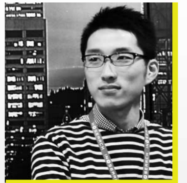
講師/株式会社 インサイト コミュニケーションデザイン部 マーケティング室