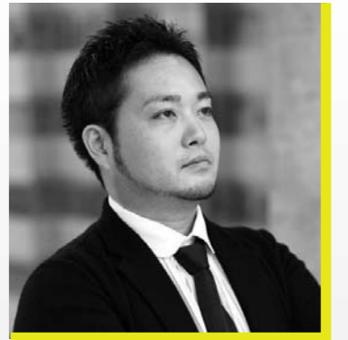
講師/株式会社 インサイト執行役員 デジタルコミュニケーション担当 株式会社 Gear8代表取締役